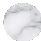
marmo bianco di Carrara